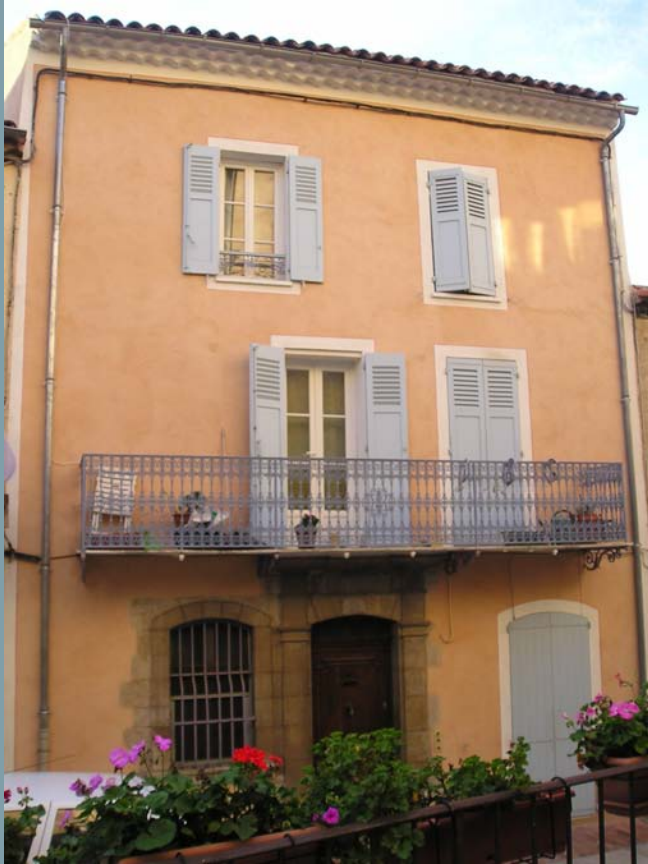
Rue Maurice Astier