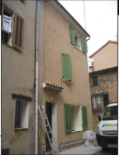
21 rue St Roch