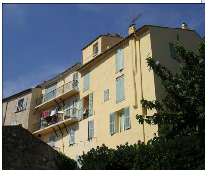
3 rue Maurice Astier - façade sud