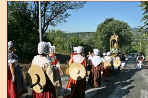
Procession de notre Dame Le 8 septembre