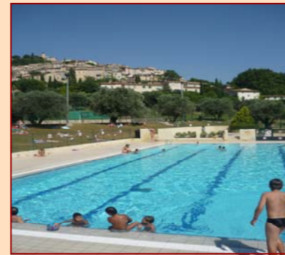
Complexe sportif « le Grand Jardin » Piscine, pataugeoire, 5 courts de tennis