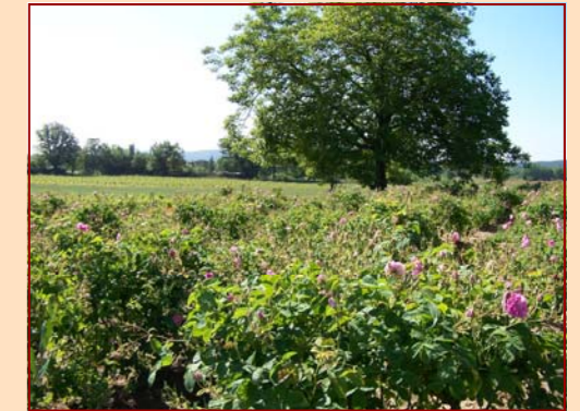
Champ de Roses Domaine Le Clos de Notre Dame