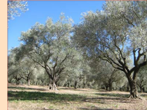
Oliveraie du Domaine de Trestaure