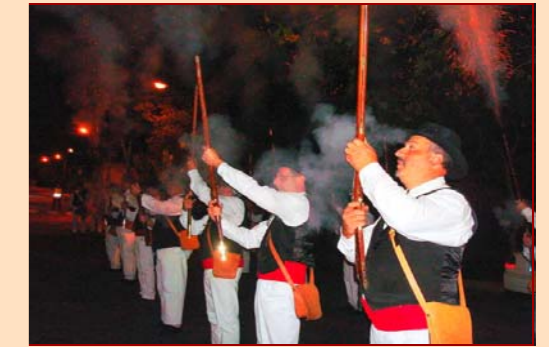
Bravade et Traditions