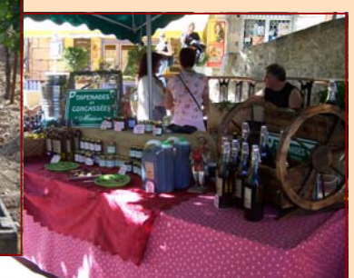
Salon Provence Gourmande