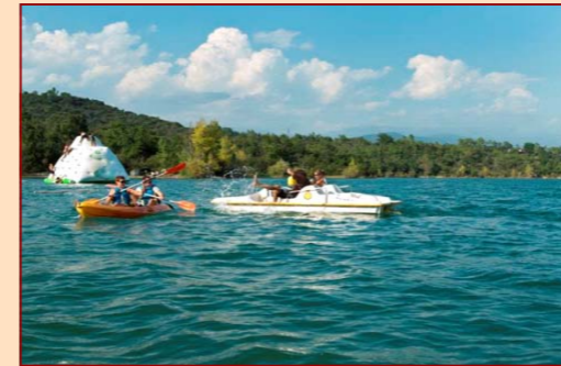
le Lac de St Cassien, A 10 mn de Fayence, baignade, pédalos, pêche, canoë, base d'aviron, snacks, Parc Aquatique, restaurants, Point i