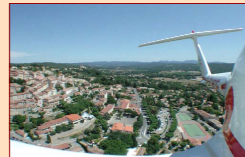
Centre International de Vol à Voile, Prenez votre envol : survolez le Pays de Fayence