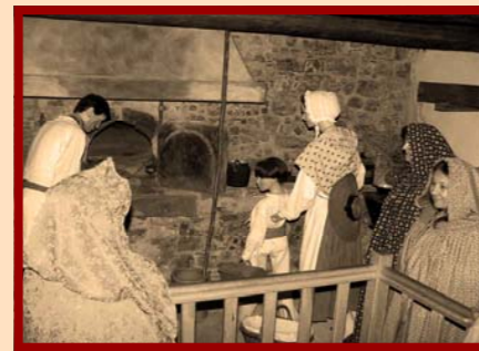
Four du Mitan Ancien Four à pain du XVI ème