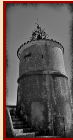
Tour de l'Horloge (1808) surplombe le village village et la Vallée

Du XI ème au XVIII ème FAYENCE fut Seigneurie des Evêques de Fréjus, leur château était construit sur l'actuelle Place de l'Horloge. L'enceinte urbaine date du XIII ème siècle et la Porte Sarrazine en est le plus beau témoignage.