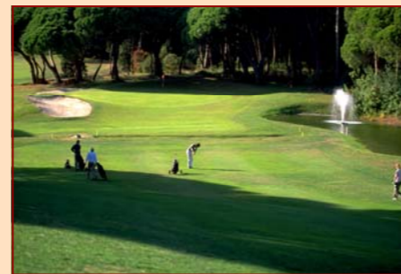
Domaine de Terre Blanche, A proximité : 2 parcours de golf, SPA