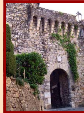
Porte Sarrazine Principale porte d'entrée dans la cité fortifiée, XIV ème