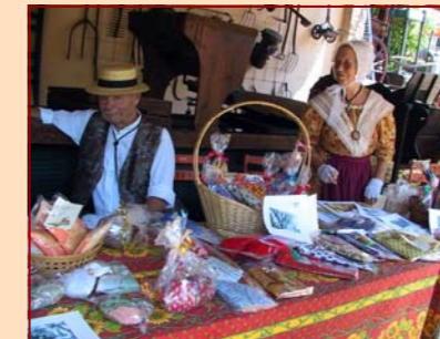
La Fête du Pain & La Fête du Moulin